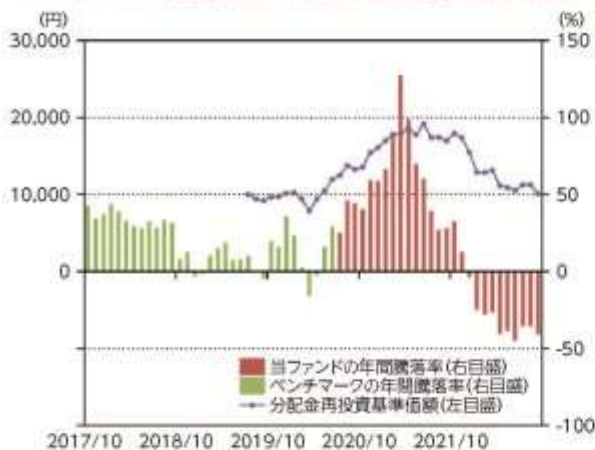
当ファンドの年間騰落率及び分配金再投資基準価額の推移