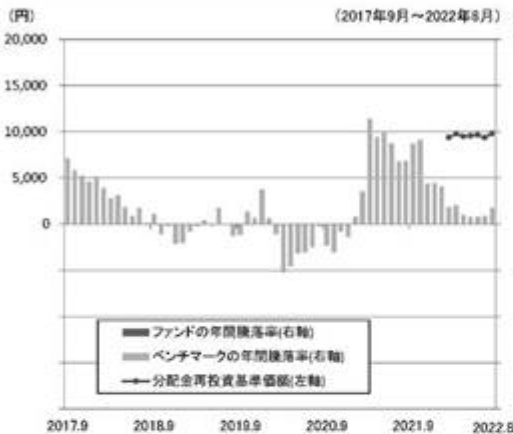
ファンドの年間騰落率と分配金再投資基準価額の推移