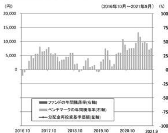
ファンドの年間騰落率と分配金再投資基準価額の推移