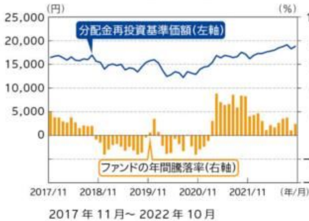
ファンドの年間騰落率及び 分配金再投資基準価額の推移