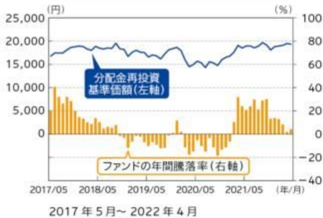
ファンドの年間騰落率及び 分配金再投資基準価額の推移