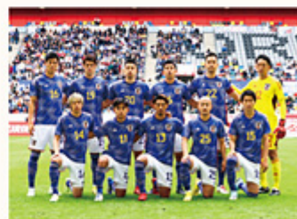
キリンチャレンジカップ2022 対アメリカ代表戦 先発メンバー(2022.9.23)

世界3大テノール歌手の一人であるホセ・カレーラス氏の音楽活動を支援しています。また、同氏が自身の白血病との闘病を克服した後に設立した「ホセ・カレーラス国際白血病財団」に対して1999年より毎年、同財団への寄付も行い、活動を支援しています。