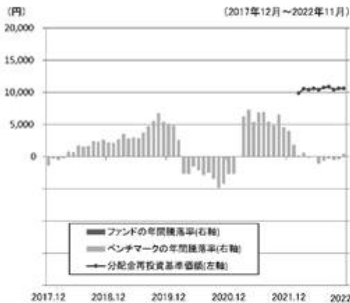
ファンドの年間騰落率と分配金再投資基準価額の推移