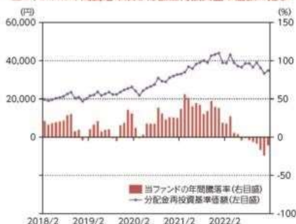
当ファンドの年間騰落率及び分配金再投資基準価額の推移

*当ファンドの年間騰落率は、税引前の分配金を再投資したものとみなして計算した年間騰落率が記載されていますので、実際の基準価額に基づいて計算した年間騰落率とは異なる場合があります。