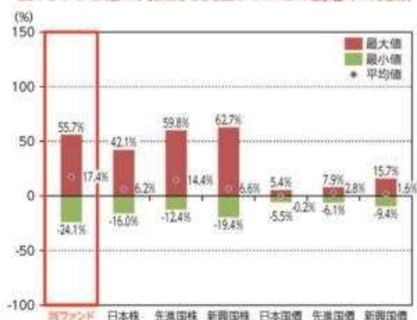
当ファンドと他の代表的な資産クラスとの騰落率の比較

*2018年2月～2023年1月の5年間の各月末における直近1年間の騰落率の平均・最大・最小を、当ファンド及び他の代表的な資産クラスについて表示し、当ファンドと他の代表的な資産クラスを定量的に比較できるように作成したものです。他の代表的な資産クラス全てが当ファンドの投資対象とは限りません。