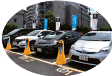
カーシェアリング事業 (例：オリックスカーシェア)