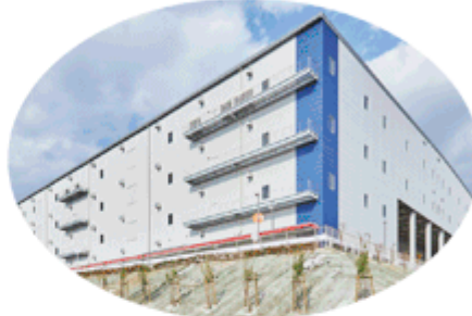
物流施設開発事業 (例：箕面ロジスティクスセンター)