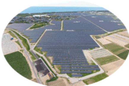
メガソーラー発電事業 (例：新潟県四ツ郷屋発電所)