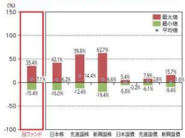
当ファンドと他の代表的な資産クラスとの騰落率の比較