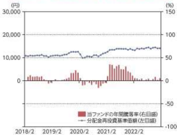
当ファンドの年間騰落率及び分配金再投資基準価額の推移