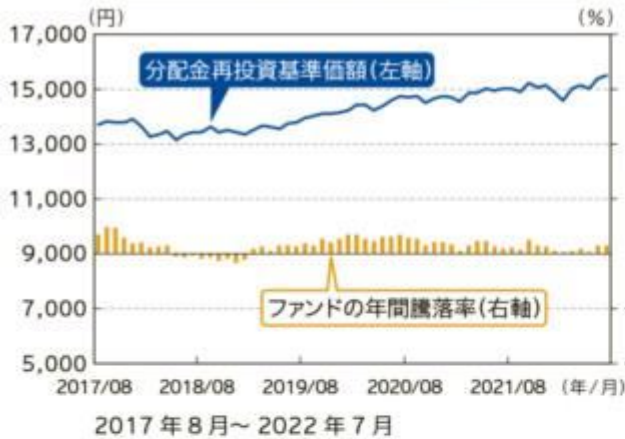
ファンドの年間騰落率及び 分配金再投資基準価額の推移