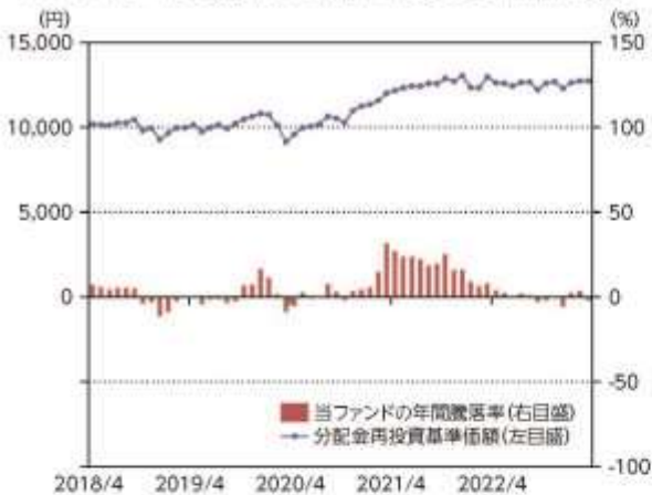
当ファンドの年間騰落率及び分配金再投資基準価額の推移

*当ファンドの年間騰落率は、税引前の分配金を再投資したものとみなして計算した年間騰落率が記載されていますので、実際の基準価額に基づいて計算した年間騰落率とは異なる場合があります。