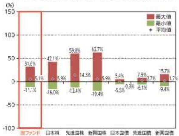
当ファンドと他の代表的な資産クラスとの騰落率の比較

*2018年4月～2023年3月の5年間の各月末における直近1年間の騰落率の平均・最大・最小を、当ファンド及び他の代表的な資産クラスについて表示し、当ファンドと他の代表的な資産クラスを定量的に比較できるように作成したものです。他の代表的な資産クラス全てが当ファンドの投資対象とは限りません。