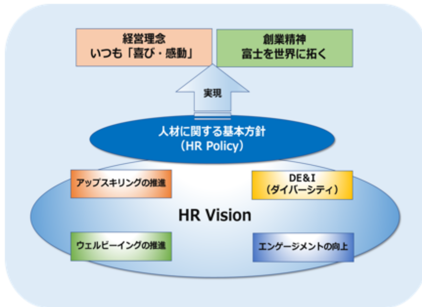
当社グループが目指す人的資本経営に関する関係図