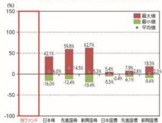
当ファンドと他の代表的な資産クラスとの騰落率の比較

*2018年7月～2023年6月の5年間の各月末における直近1年間の騰落率の平均・最大・最小を、当ファンド及び他の代表的な資産クラスについて表示し、当ファンドと他の代表的な資産クラスを定量的に比較できるように作成したものです。他の代表的な資産クラス全てが当ファンドの投資対象とは限りません。