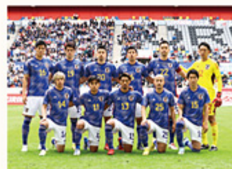
オリンピック2022 対アメリカ代表戦 先発メンバー(2022.9.23)

世界3大テノール歌手の一人であるホセ・カレーラス氏の音楽活動を支援しています。また、同氏が自身の白血病との闘病を克服した後に設立した「ホセ・カレーラス国際白血病財団」に対して1999年より毎年、同財団への寄付も行い、活動を支援しています。