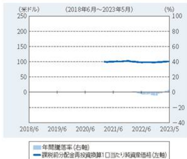
ファンドの年間騰落率および 分配金再投資1口当たり純資産価格の推移