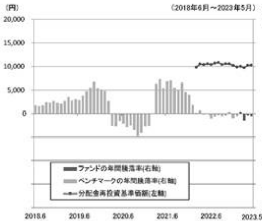
ファンドの年間騰落率と分配金再投資基準価額の推移