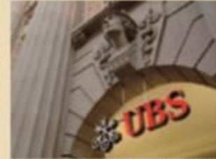
チューリッヒにあるUBSビル(スイス)

(出所)UBSアセット・マネジメントのデータを基に三井住友トラスト・アセットマネジメント作成