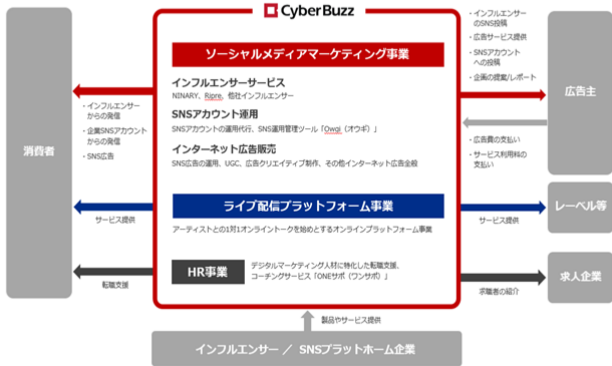
[ 事業系統図 ]