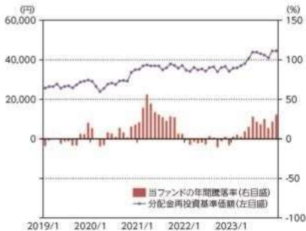
当ファンドの年間騰落率及び分配金再投資基準価額の推移

*当ファンドの年間騰落率は、税引前の分配金を再投資したものとみなして計算した年間騰落率が記載されていますので、実際の基準価額に基づいて計算した年間騰落率とは異なる場合があります。