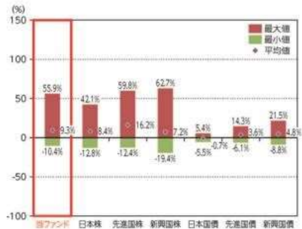
当ファンドと他の代表的な資産クラスとの騰落率の比較

*2019年1月～2023年12月の5年間の各月末における直近1年間の騰落率の平均・最大・最小を、当ファンド及び他の代表的な資産クラスについて表示し、当ファンドと他の代表的な資産クラスを定量的に比較できるように作成したものです。他の代表的な資産クラス全てが当ファンドの投資対象とは限りません。