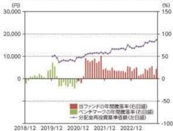
当ファンドの年間騰落率及び分配金再投資基準価額の推移