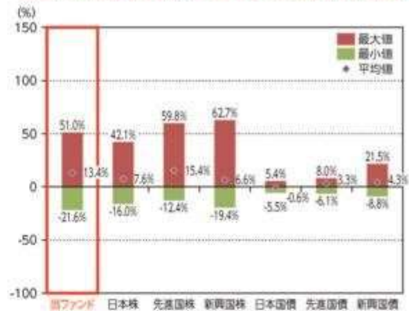
当ファンドと他の代表的な資産クラスとの騰落率の比較