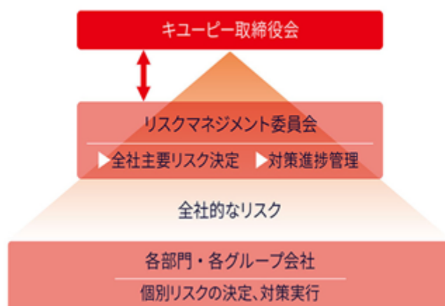
キューピーグループのリスクマネジメント体制

リスクの評価と選定については、社内外の経営環境の変化を広く見据え今後リスクとなりうることを洗い出し、それらの評価を行うことで重要なリスクを見極めています。「各リスクの経営への影響の大きさ」と「そのリスクの管理の程度（マネジメントコントロール度）」の2軸で評価し、対策すべきリスクを選定し優先順位づけをしています。経営への影響度が大きいにも関わらずマネジメントコントロールが不十分なリスクは『全社主要リスク』として全社横断的なプロジェクトにより、最優先でリスク低減に努めています。活動を通じて対策が効果を上げ、マネジメントコントロールが高まったとしても、依然として経営への影響度が大きい場合は、その後の状況を監査などにより確認しています。経営への影響度が小さく経営課題とならない場合においても、感度高く社外情報の収集、モニタリングに努めています。このように社内社外両面からモニタリングを行い状況変化に応じた重要性を適時評価し機敏にリスクに向き合うように努めています。