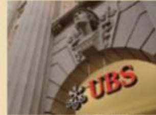
チューリッヒにあるUBSビル(スイス)