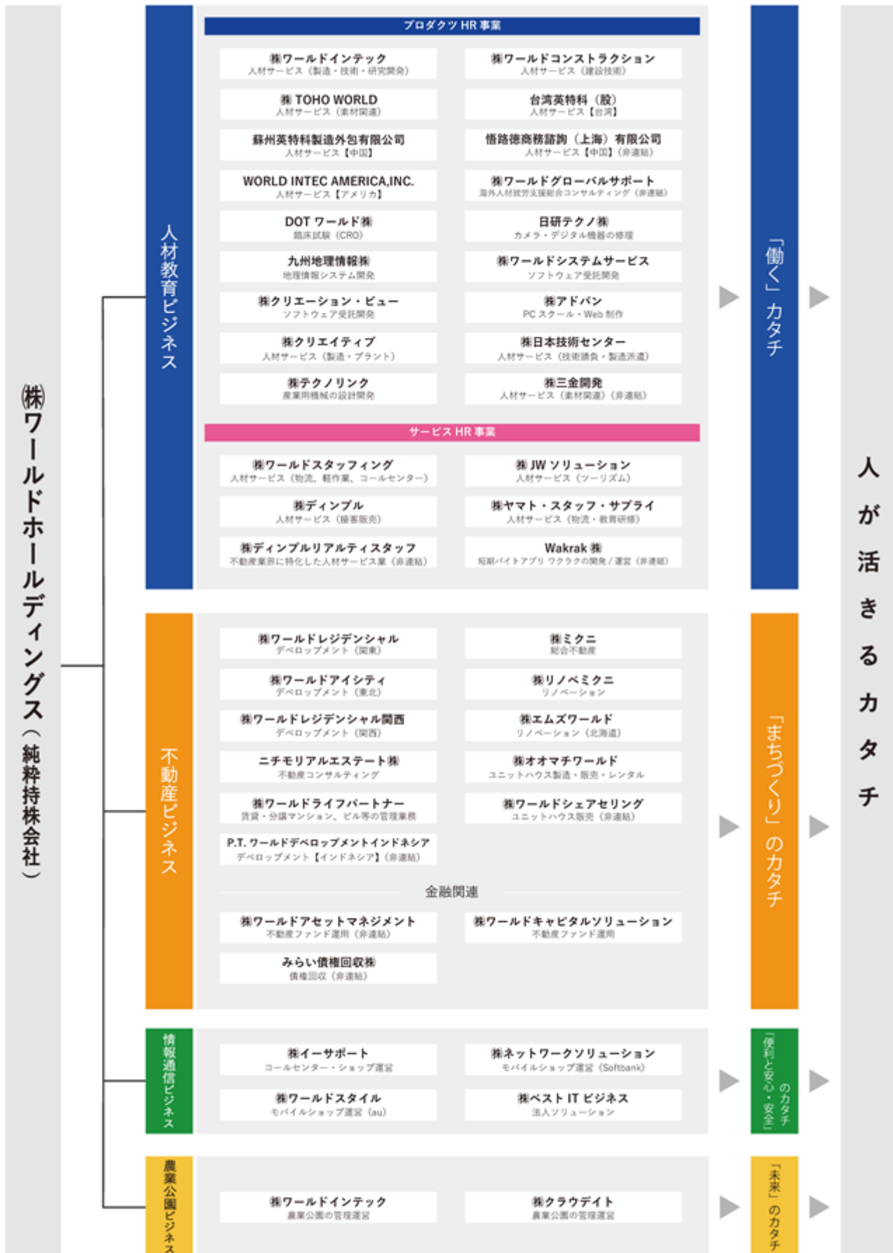
[ 事業系統図 ]