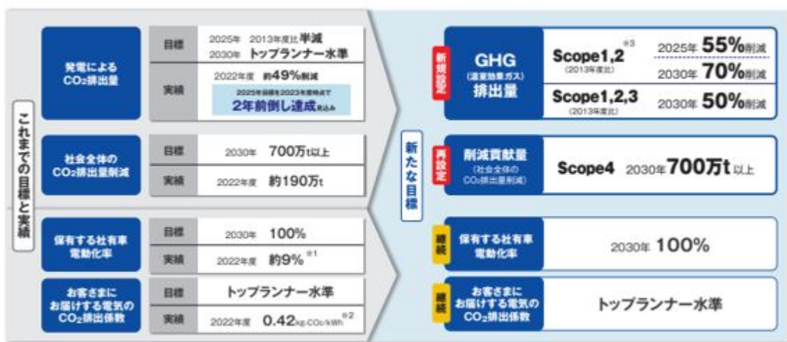
図 ゼロカーボンロードマップ ロードマップの全体像