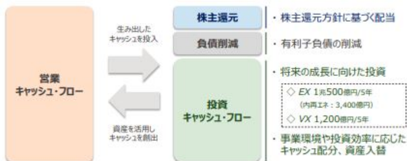
図 関西電力グループ中期経営計画（2021-2025）のアップデート キャッシュ配分