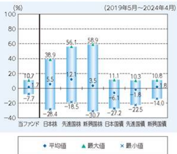
ファンドと他の代表的な資産クラスとの 騰落率の比較

※上記グラフは、上記期間の各月末における直近1年間の騰落率の平均値・最大値・最小値を表示したものであり、ファンドと代表的な資産クラスを定量的に比較できるように作成しています。ただし、ファンドは直近1年間の騰落率が5年分ないため、設定日以降算出できる値を使用しています。全ての資産クラスがファンドの投資対象とは限りません。