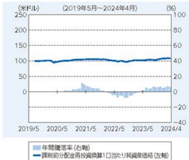
ファンドの年間騰落率および 分配金再投資1口当たり純資産価格の推移

※年間騰落率は、基準通貨である米ドル建てで計算されています。したがって、円貨に換算した場合、上記とは異なる騰落率となります。