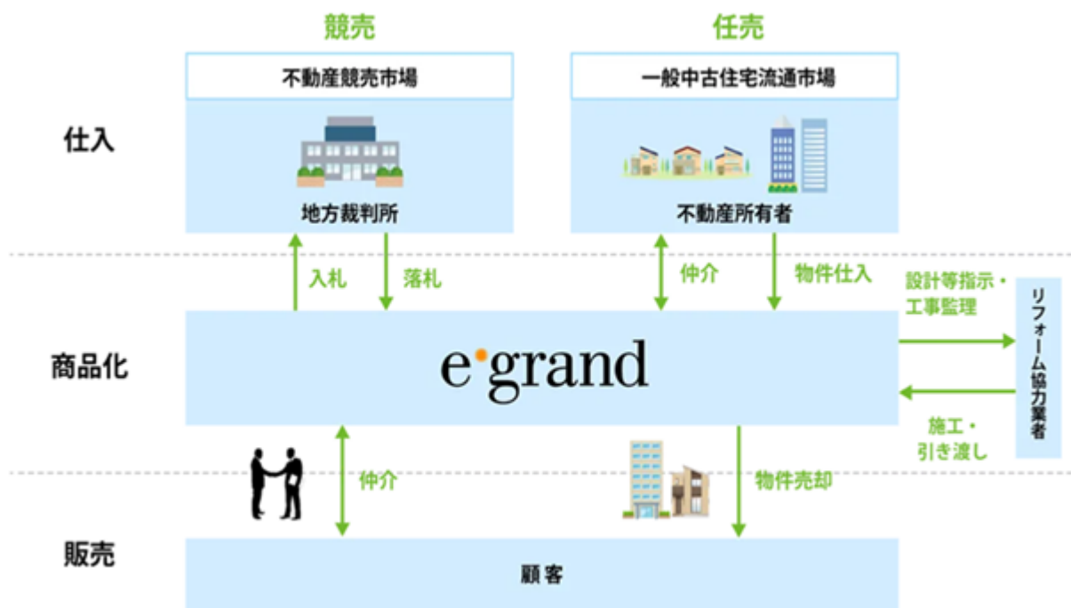
[ 事業系統図 ]