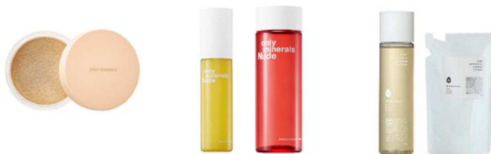
蓋の一部に再生プラスチックを使用