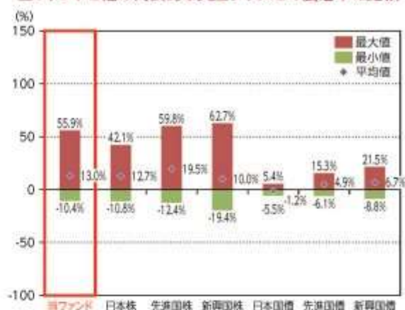
当ファンドと他の代表的な資産クラスとの騰落率の比較

*2019年7月～2024年6月の5年間の各月末における直近1年間の騰落率の平均・最大・最小を、当ファンド及び他の代表的な資産クラスについて表示し、当ファンドと他の代表的な資産クラスを定量的に比較できるように作成したものです。他の代表的な資産クラス全てが当ファンドの投資対象とは限りません。