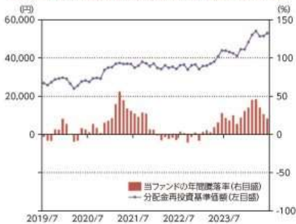
当ファンドの年間騰落率及び分配金再投資基準価額の推移

*当ファンドの年間騰落率は、税引前の分配金を再投資したものとみなして計算した年間騰落率が記載されていますので、実際の基準価額に基づいて計算した年間騰落率とは異なる場合があります。