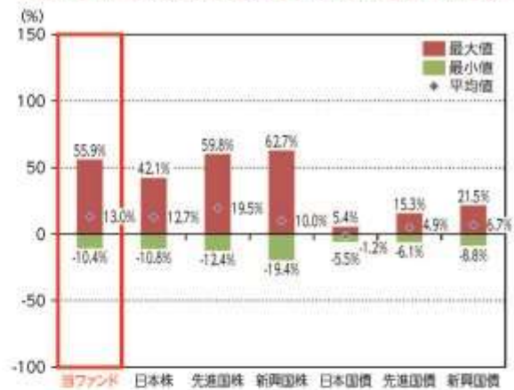
当ファンドと他の代表的な資産クラスとの騰落率の比較

*2019年7月～2024年6月の5年間の各月末における直近1年間の騰落率の平均・最大・最小を、当ファンド及び他の代表的な資産クラスについて表示し、当ファンドと他の代表的な資産クラスを定量的に比較できるように作成したものです。他の代表的な資産クラス全てが当ファンドの投資対象とは限りません。