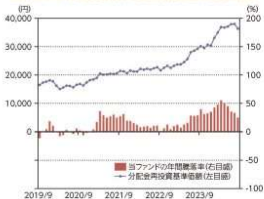
当ファンドの年間騰落率及び分配金再投資基準価額の推移

*当ファンドの年間騰落率は、税引前の分配金を再投資したものとみなして計算した年間騰落率が記載されていますので、実際の基準価額に基づいて計算した年間騰落率とは異なる場合があります。