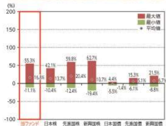
当ファンドと他の代表的な資産クラスとの騰落率の比較

*2019年9月～2024年8月の5年間の各月末における直近1年間の騰落率の平均・最大・最小を、当ファンド及び他の代表的な資産クラスについて表示し、当ファンドと他の代表的な資産クラスを定量的に比較できるように作成したものです。他の代表的な資産クラス全てが当ファンドの投資対象とは限りません。