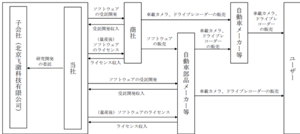
当社グループ (画像認識ソフトウェアの開発及び販売)