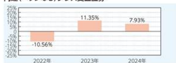
円建(ヘッジなし)クラス受益証券