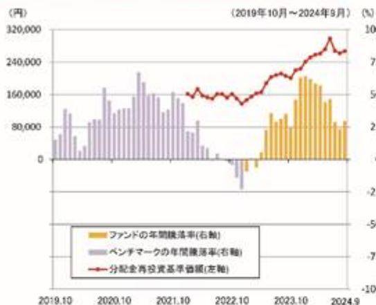
ファンドの年間騰落率と分配金再投資基準価額の推移