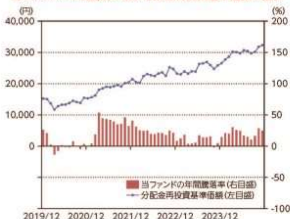
当ファンドの年間騰落率及び分配金再投資基準価額の推移