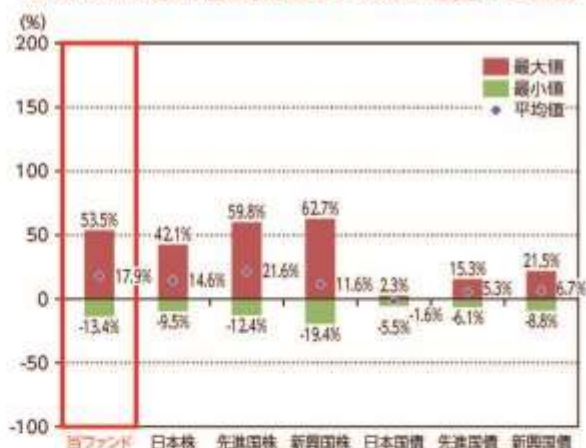
当ファンドと他の代表的な資産クラスとの騰落率の比較