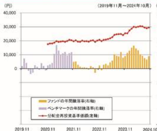
ファンドの年間騰落率と分配金再投資基準価額の推移