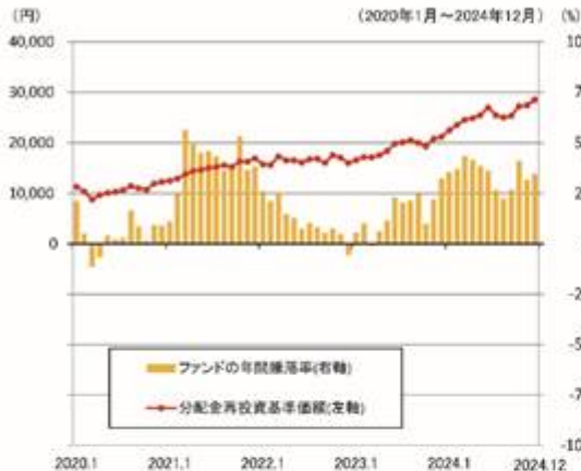
ファンドの年間騰落率と分配金再投資基準価額の推移