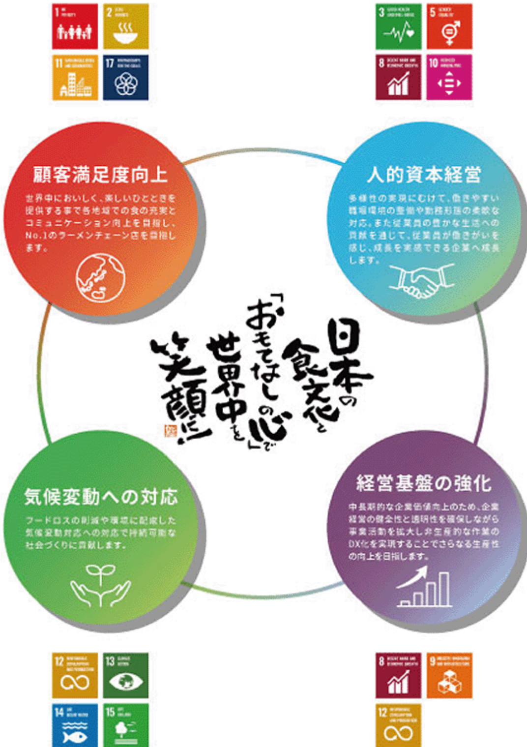
<マテリアリティ主要テーマ概要図>