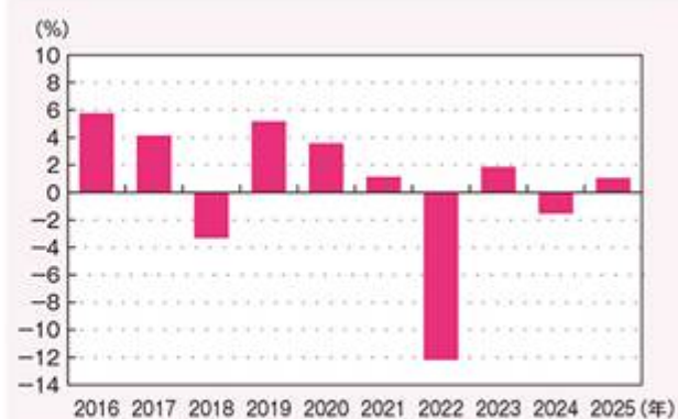
円ー毎月分配クラス