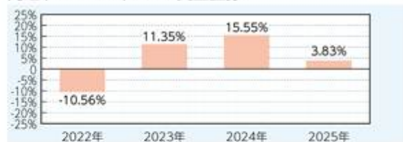
円建(ヘッジなし)クラス受益証券