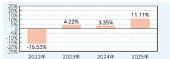
米ドル建クラス受益証券