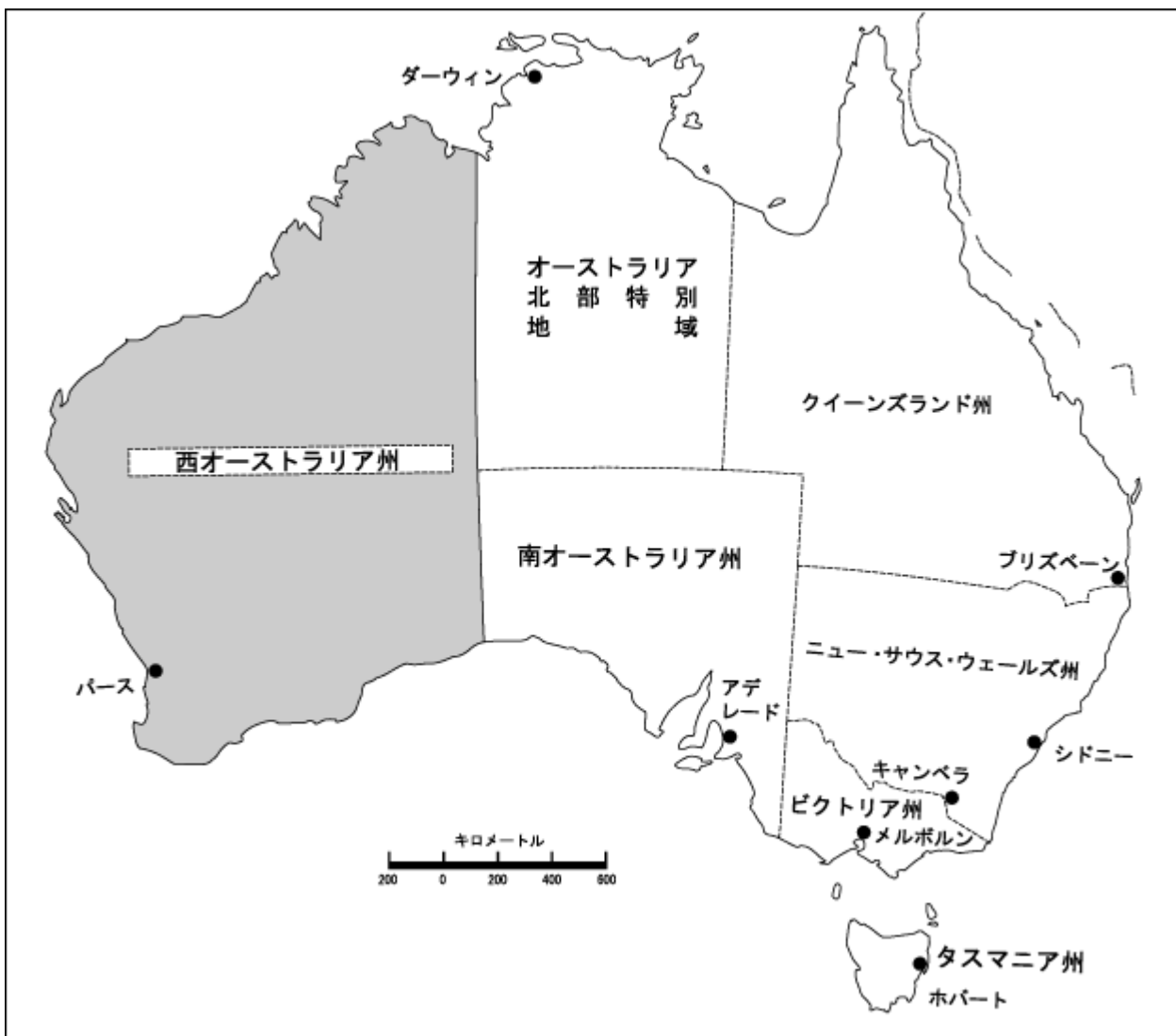
オーストラリア連邦

2025年3月、西オーストラリア州の推計人口は約300万人であり、オーストラリアの人口2,750万人の11.0%を占めた。西オーストラリア州は、2025年3月までの1年間に全ての州及び特別地域の中で最も急速に人口が増加し、国全体の増加率(1.6%)をかなり上回る2.3%であった。西オーストラリア州はオーストラリアの州及び特別地域の中で4番目に人口が多い州であった。