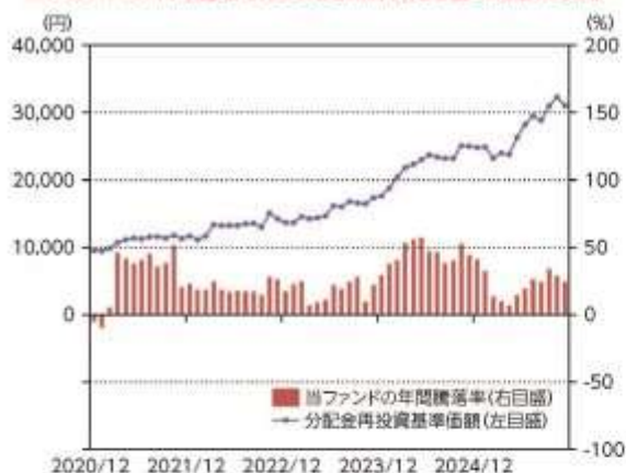
当ファンドの年間騰落率及び分配金再投資基準価額の推移

*当ファンドの年間騰落率は、税引前の分配金を再投資したものとみなして計算した年間騰落率が記載されていますので、実際の基準価額に基づいて計算した年間騰落率とは異なる場合があります。