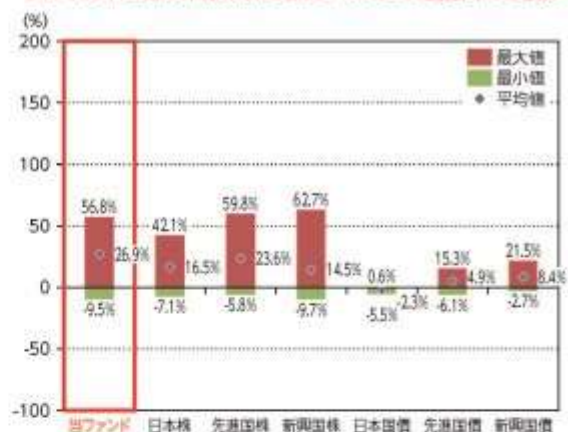
当ファンドと他の代表的な資産クラスとの騰落率の比較

*2020年12月～2025年11月の5年間の各月末における直近1年間の騰落率の平均・最大・最小を、当ファンド及び他の代表的な資産クラスについて表示し、当ファンドと他の代表的な資産クラスを定量的に比較できるように作成したものです。他の代表的な資産クラス全てが当ファンドの投資対象とは限りません。