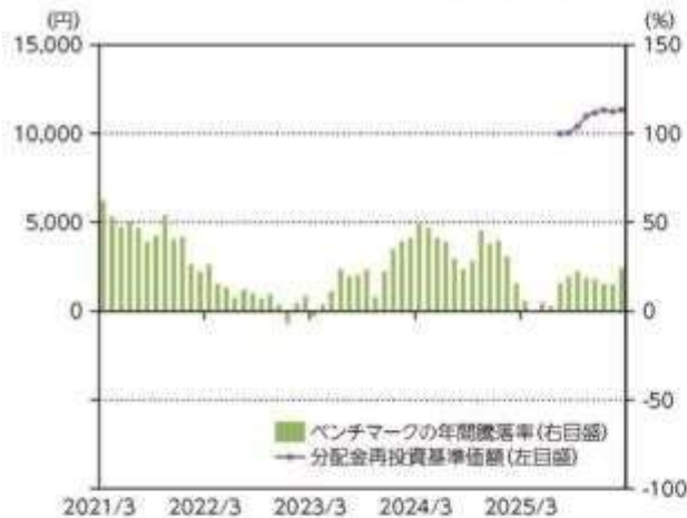
当ファンドの年間騰落率及び分配金再投資基準価額の推移