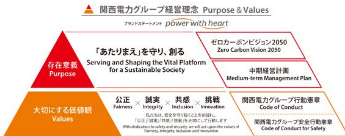
図 関西電力グループ 経営理念 ( Purpose & Values ) ・ ブランドステートメント ( power with heart )