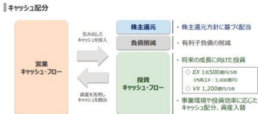
図 関西電力グループ中期経営計画（2021-2025）のアップデート キャッシュ配分